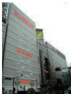
ビックカメラ 本店 ヤマダ電機

東京都豊島区東池袋 2丁目 63-1 TEL03-3988-5228 (管理組合)